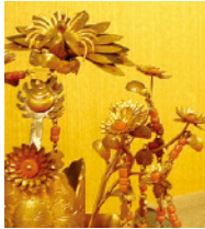
天冠(女雛がつける冠)