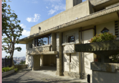
ヨドコウ迎賓館(旧山邑家住宅)